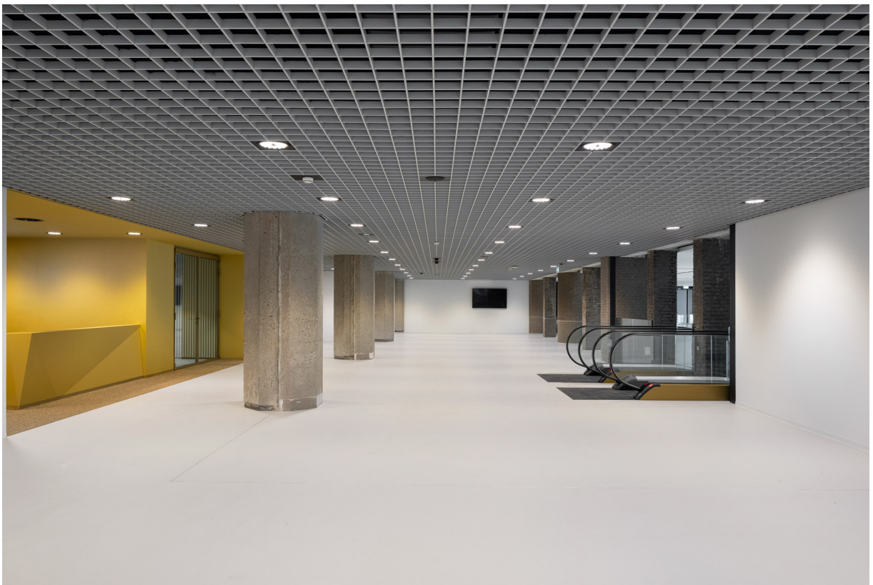
Roltrappen vanaf de Statenpassage naar de publieke tribune