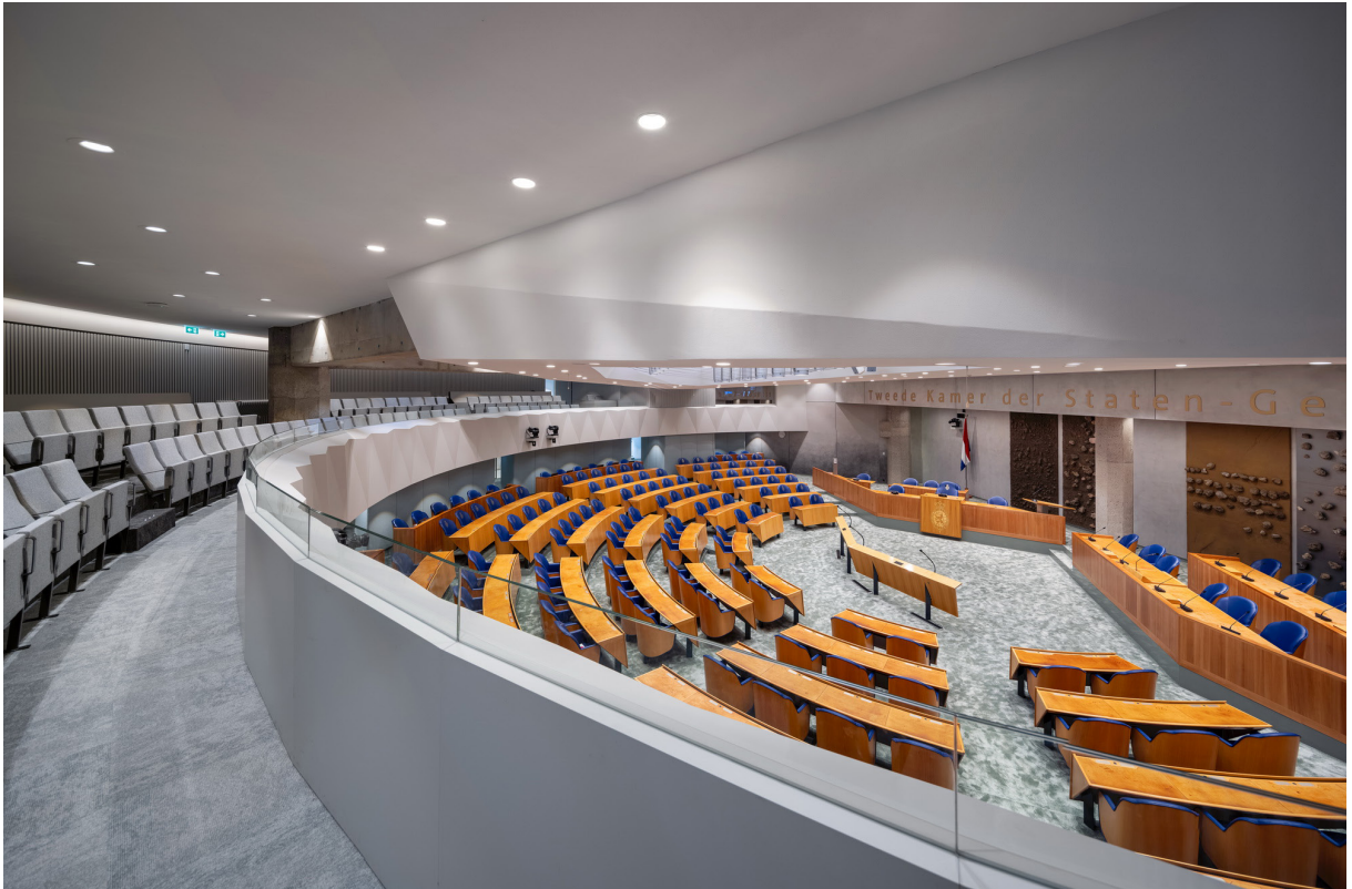
Publieke tribune plenaire zaal