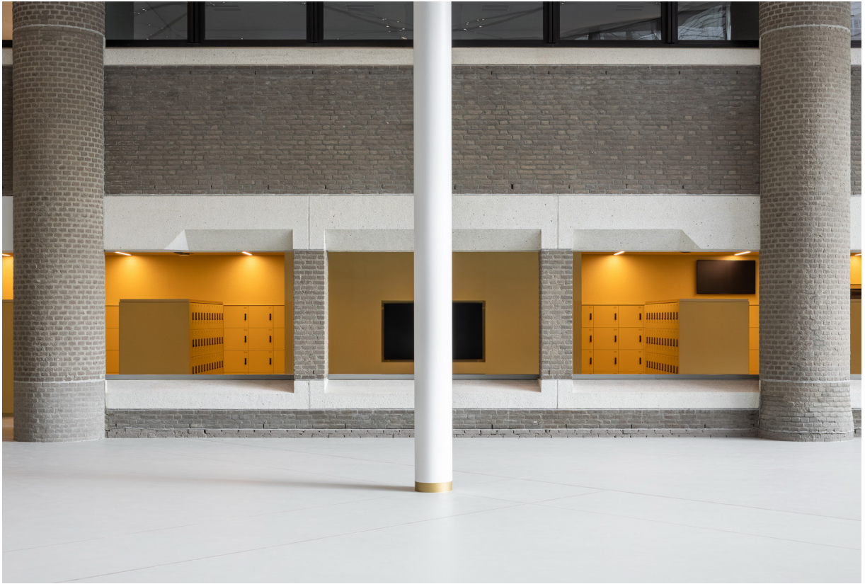
Garderobe voor publiek