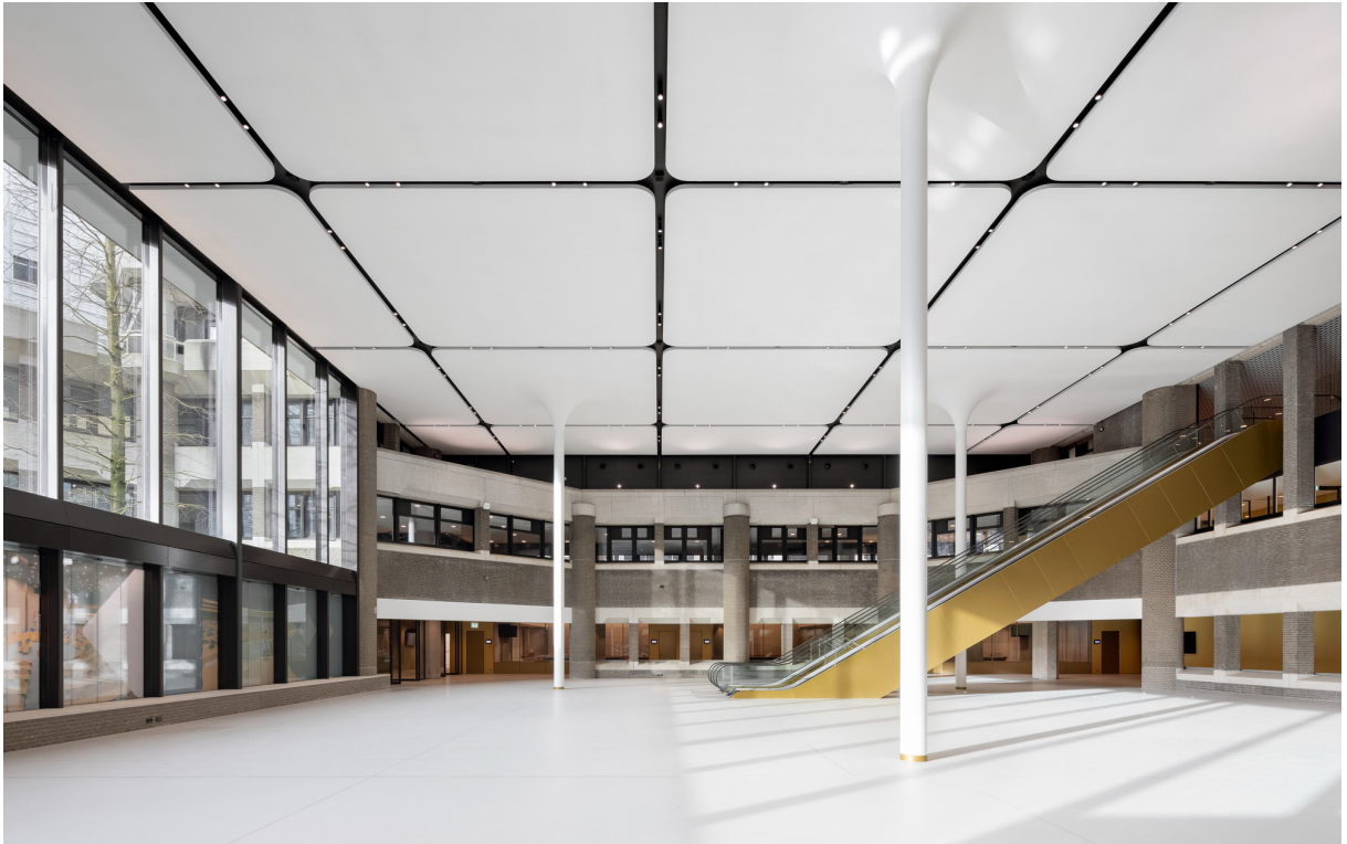
Statenpassage met roltrappen naar publieke tribune

De witte gekromde gedeeltes van de luifel, die opvallen door hun gewezen, netachtige textuur, zijn bekleed met 3D geprinte kunststof (een samenwerking met Aectual). Het materiaal, hergebruikt plastic, is 100% circulair. Wat Zecc betreft was het belangrijk het duurzaamheidsthema, dat ook binnenin het gebouw een grote rol speelt, alvast manifest te maken bij de ingang van het parlementaire gebouw.