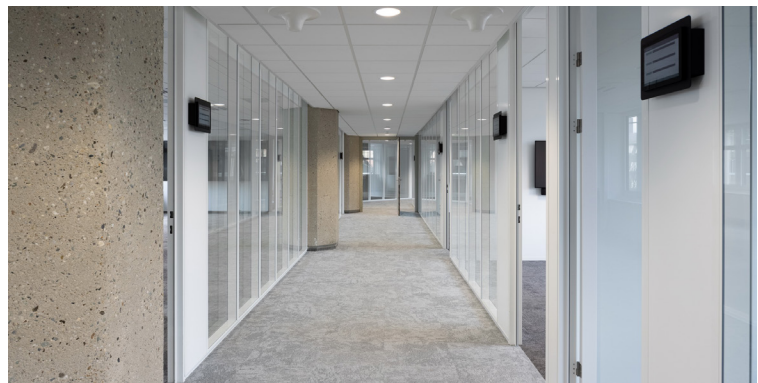
Links: commissiezaal, rechts: kantoren