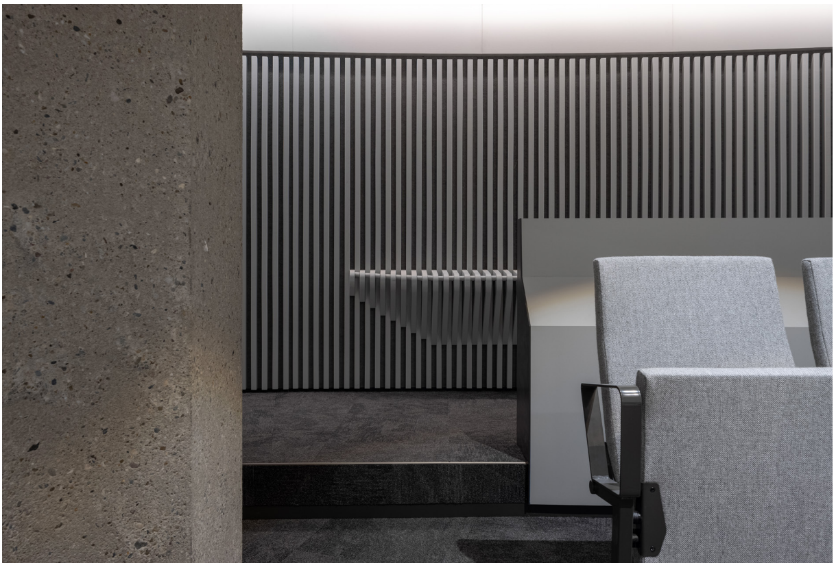
Detail publieke tribune