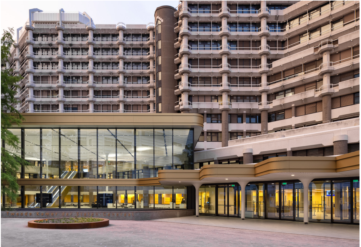
Publieksentree - stationszijde

Zecc Architecten werd door het Rijksvastgoedbedrijf geselecteerd voor deze opgave omwille van de pragmatische, gegronde, 'typisch Nederlandse' werkwijze waar het bureau om bekend staat. Zelf noemt Zecc deze manier van aanpak 'Grounded Architecture', een vorm van ontwerpen die functioneel, duurzaam en zinnenprikkelend is. Deze werkwijze heeft zich bewezen in succesvolle transformaties van openbare gebouwen zoals het Drents Archief en de Utrechtse Bibliotheek aan de Neude. Beide projecten werden gewaardeerd om de ruimtelijke kwaliteit en de juiste balans tussen karakteristieke elementen én nieuwe toevoegingen. In samenwerkingen heeft Zecc de reputatie zich meedenkend en optimistisch op te stellen. Dit profiel, in combinatie met de reeds opgebouwde ervaring en gerealiseerde projecten, sloot wat het Rijksvastgoedbedrijf betreft ideaal aan op de uitdaging een tijdelijk onderkomen te creëren voor de Tweede Kamer.