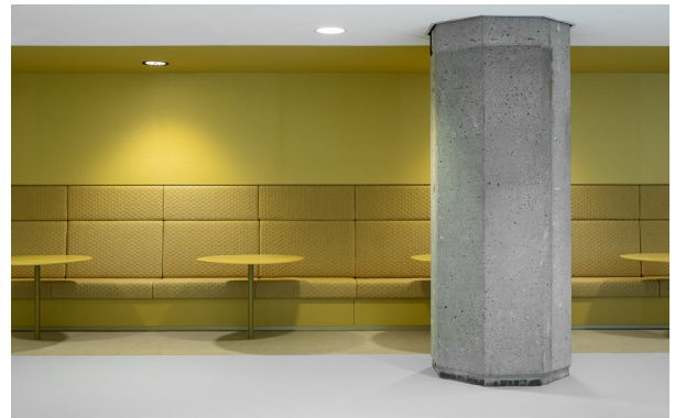
Boven en rechtsonder: zitjes eerste verdieping rond plenaire zaal, links: lockers publiek