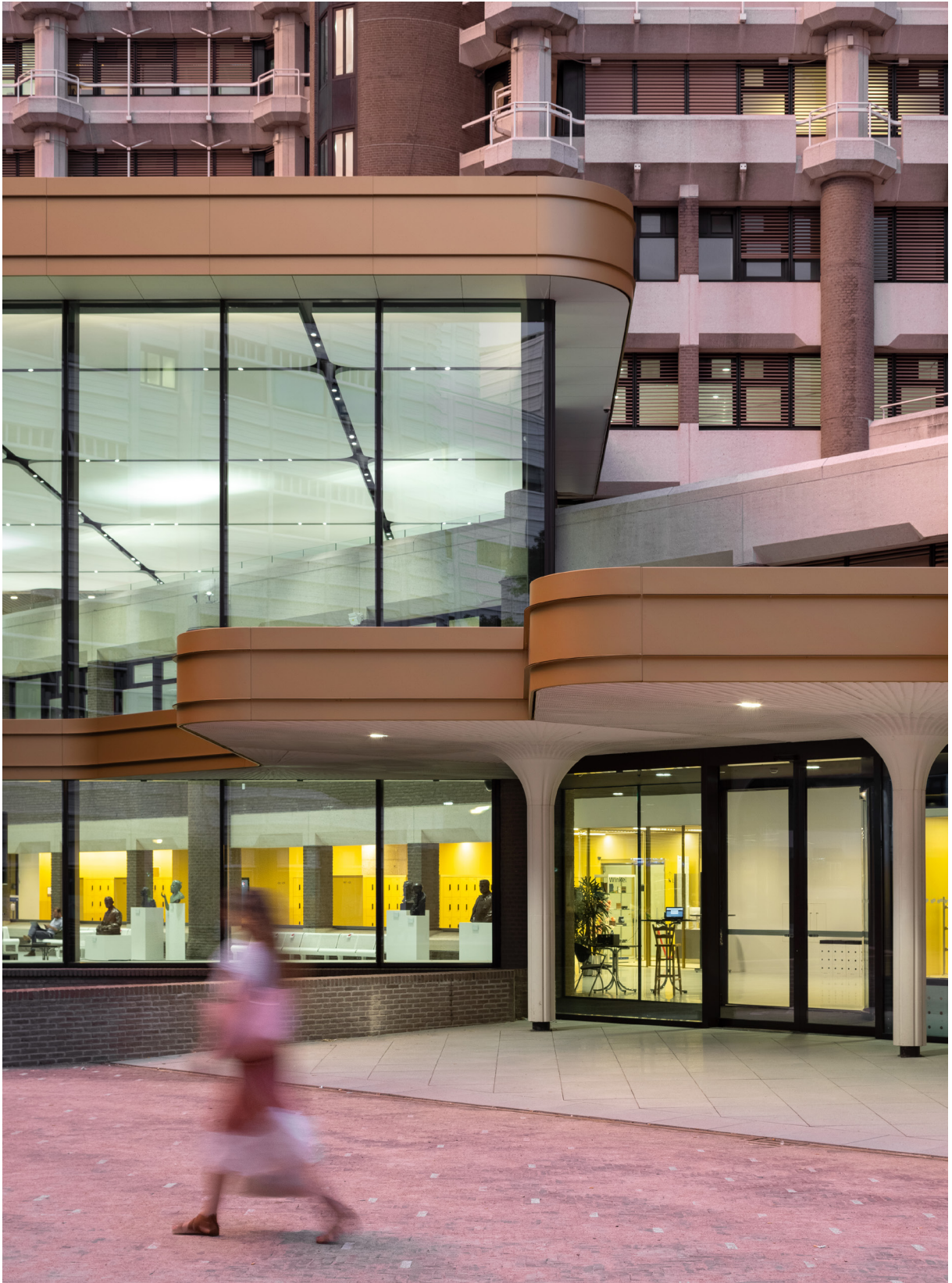
Publieksentree - stationszijde