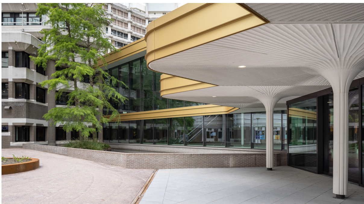
Publieksentree - stationszijde

De Tweede Kamer heeft dit zomerreces haar tijdelijke huisvesting betrokken aan de Bezuidenhoutseweg 67. In dit door Dick Apon ontworpen gebouw was tot voor kort het ministerie van Buitenlandse Zaken gevestigd. Zecc Architecten werd door het Rijksvastgoedbedrijf geselecteerd om dit bestaande gebouw om te vormen tot een 'tijdelijk huis voor de democratie'. 'Een uitdagende en eervolle opgave waar je natuurlijk geen nee tegen kon zeggen', zo vat architect Bart Kellerhuis het samen. 'We zijn enorm trots dat we de tijdelijke huisvesting voor de Tweede Kamer hebben mogen ontwerpen.' Om aan de uitgebreide (veiligheids)eisen van alle betrokken partijen te voldoen, kwam Zecc met een weerbaar ontwerp waarin de focus ligt op functionaliteit. 'De ultieme uitdaging was om twee tegengestelde waarden, toegankelijkheid en beveiliging, in één gebouw te verenigen.' Om dit te bewerkstelligen, werd aan de al bestaande ingang een tweede ingang toegevoegd. Deze publieksentree, aan de zijde van het Centraal Station van Den Haag, is speciaal bedoeld om de honderdduizenden bezoekers die jaarlijks de Tweede Kamer bezoeken op een waardige manier te ontvangen. Tevens creëert de nieuwe entree een lichtpunt in een verder wat sombere en gesloten omgeving.