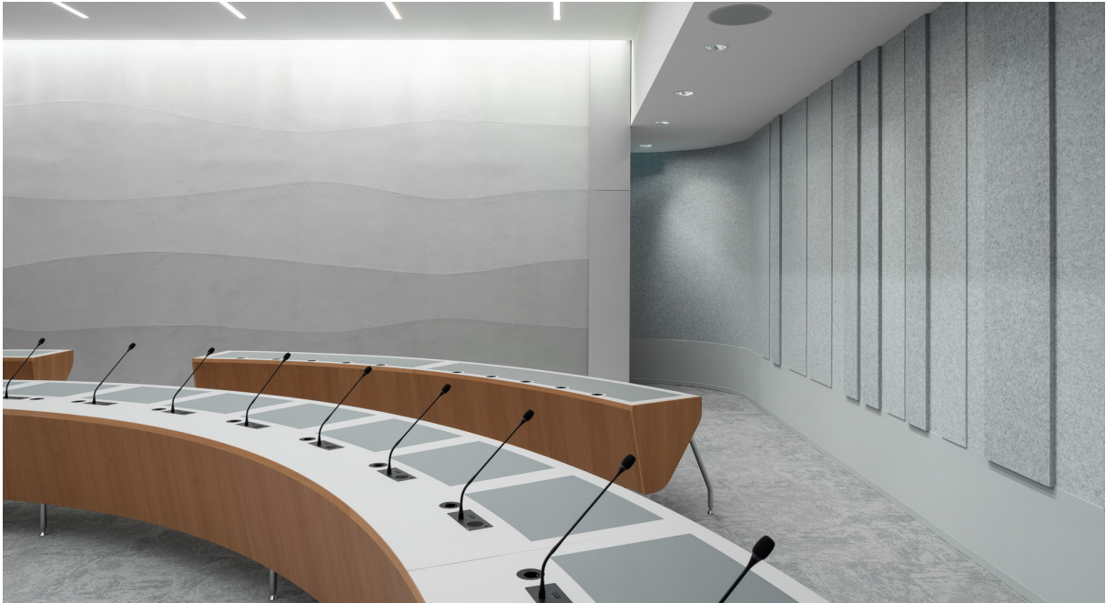
Eén van de drie grote commissiezalen