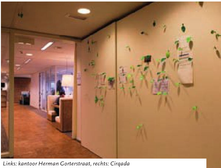
Links: kantoor Herman Gorterstraat, rechts: Cirqada