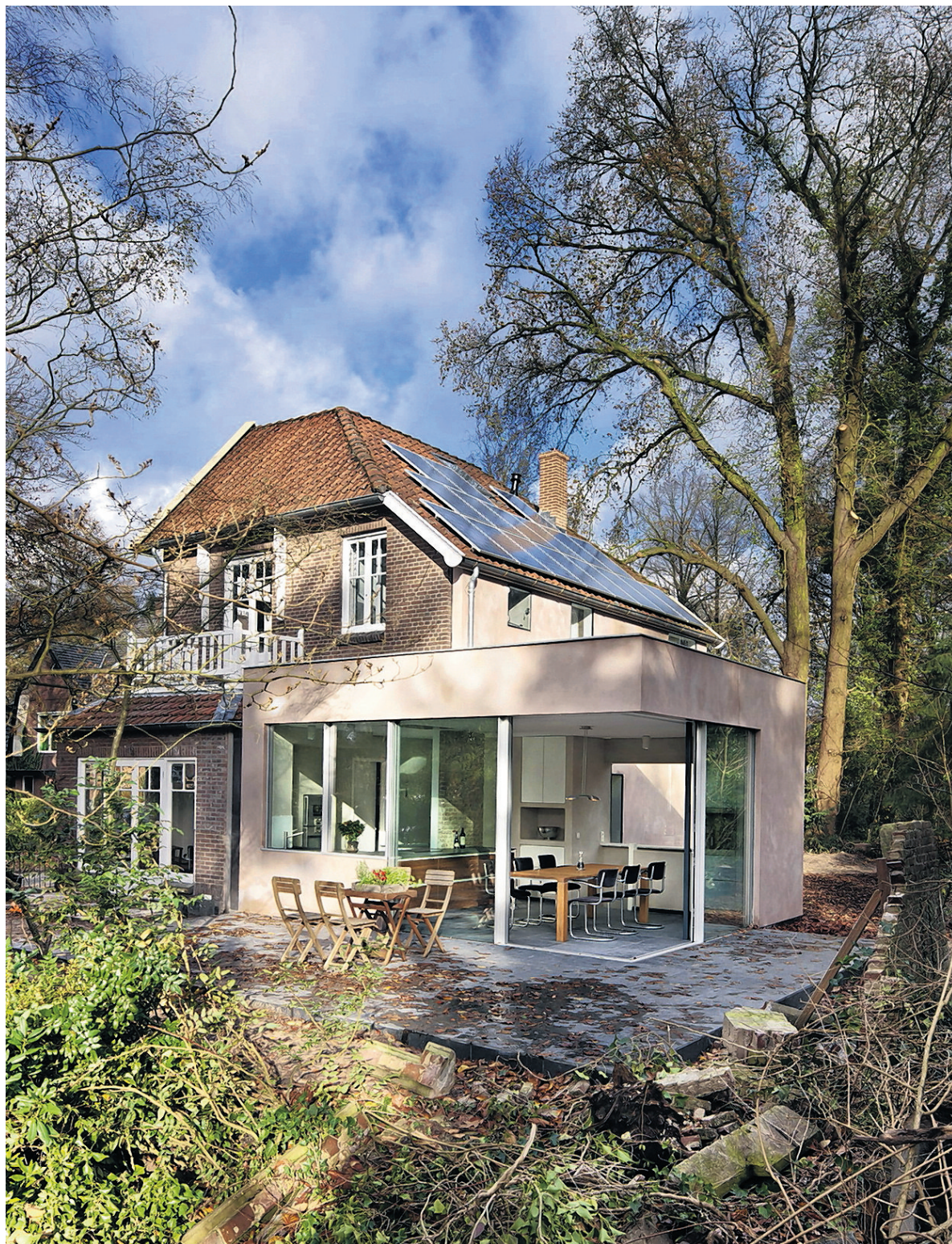
Energieneutraal monument in Driebergen van Zecc Architecten, winnaar Noordwest/Centrum

Een krachtig gebouw met een moderne uitstraling en heldere indeling, typeert de jury dit gebouw voor de Hogeschool voor journalistiek en economie. Zonlicht dringt dankzij het centrale atrium diep het gebouw in, dat ook nog eens zeer duurzaam is. 'Dit moet een feest zijn om in te studeren', aldus de jury.