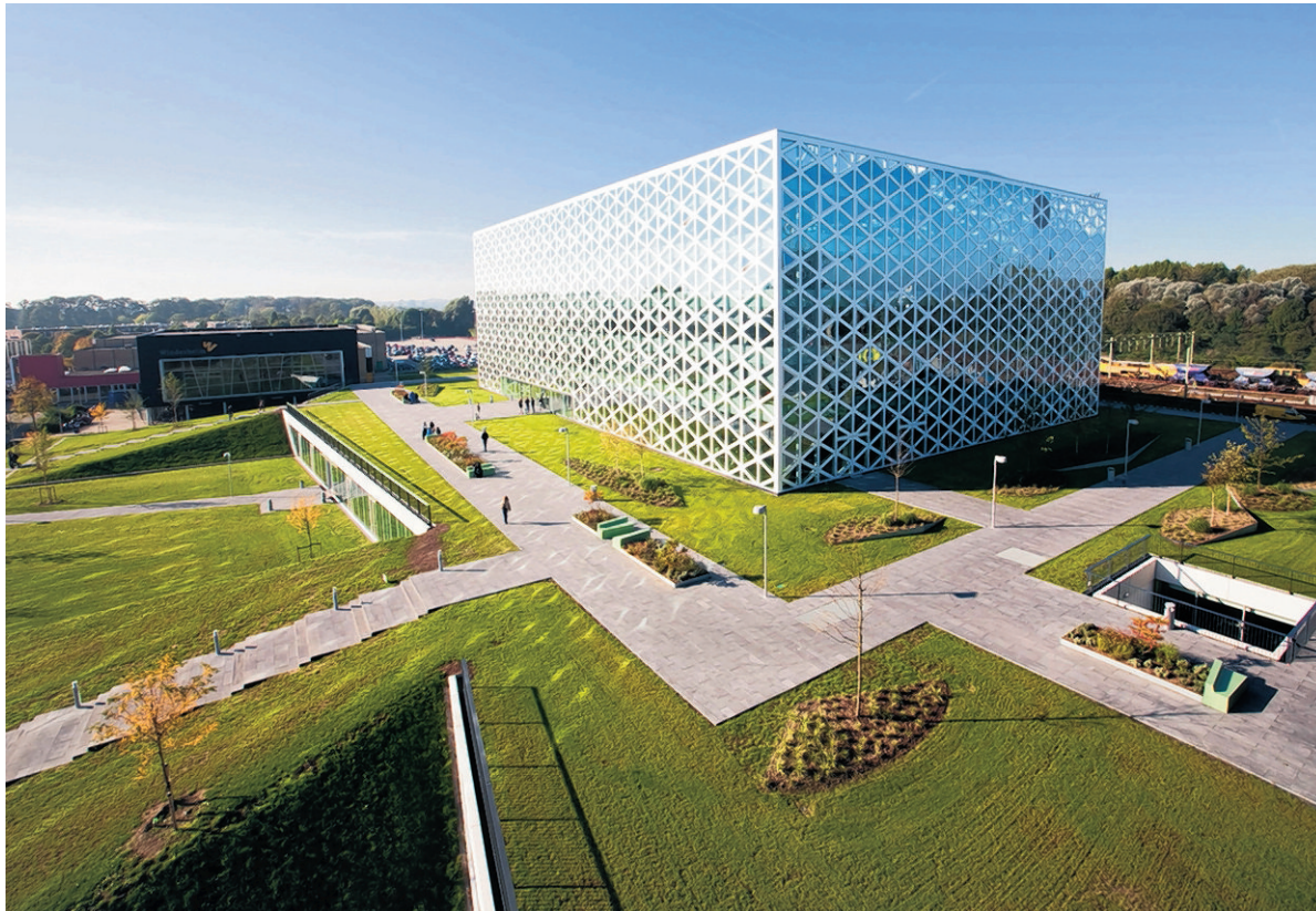
Windesheim Gebouw X in Zwolle, Broekbakema, winnaar Oost

Een krachtig gebouw met een moderne uitstraling en heldere indeling, typeert de jury dit gebouw voor de Hogeschool voor journalistiek en economie. Zonlicht dringt dankzij het centrale atrium diep het gebouw in, dat ook nog eens zeer duurzaam is. 'Dit moet een feest zijn om in te studeren', aldus de jury.