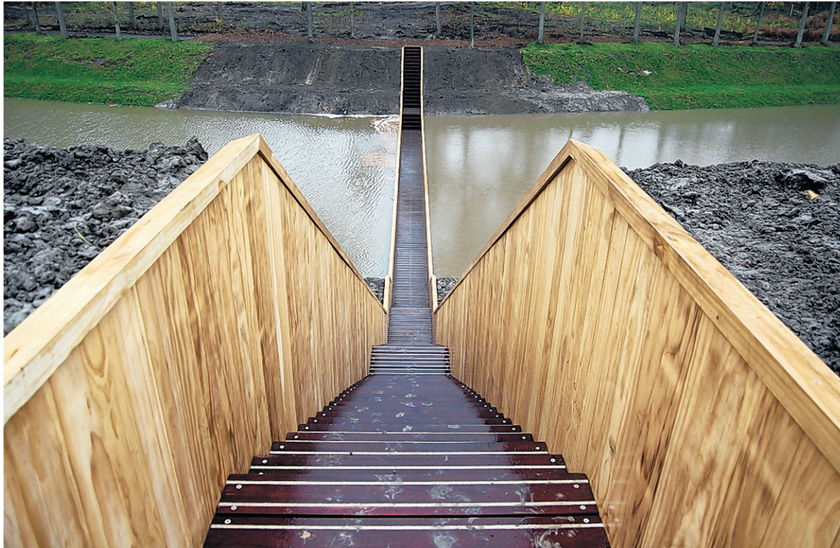
Voetgangersbrug voor Fort de Roovere in Halsteren, RO&AD Architecten, winnaar Zuid

Zoals elk jaar is er ook weer een frivool buitenbeentje: dat is een 'onzichtbare' loopgraafbrug voor Fort de Roovere in Halsteren van Ro&AD Architecten. De brug ligt als een sleuf in de gracht om het voormalige verdedigingswerk en volgt fraai de contouren van het landschap. Pas als je dichterbij komt openbaart zich de sleuf naar het fort.