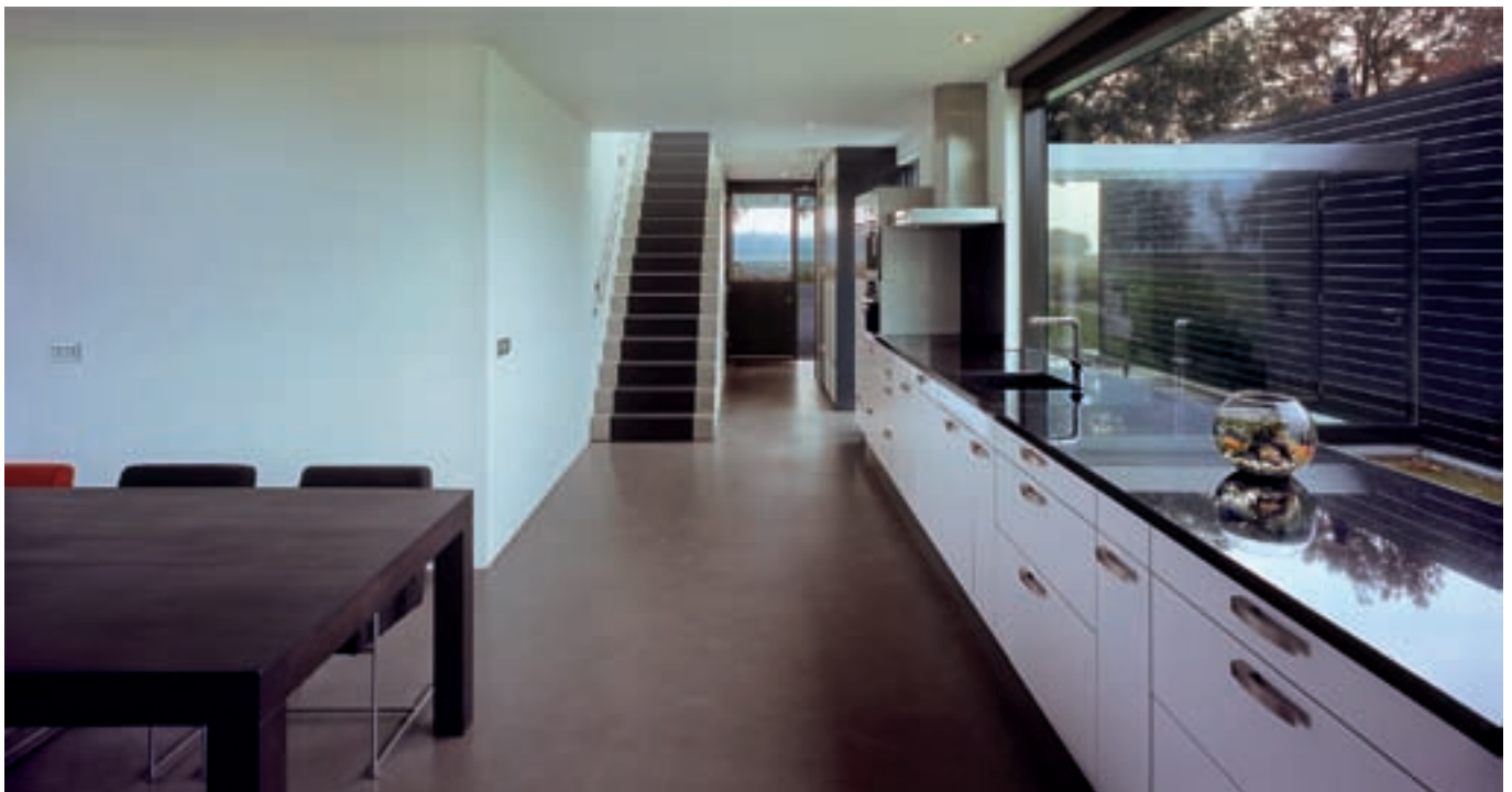
De grote keuken vormt het hart. Hiervandaan leiden trappen naar de kinderkamers en schuifdeuren naar de gelijkvloerse kamers.