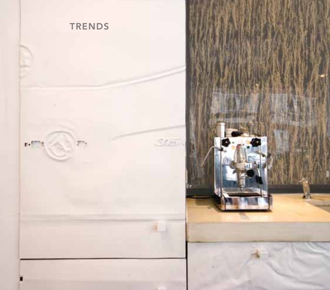
Kastdeuren blijken platgewalste autodeuren

praten over kleuren, dan kom je nergens, maar wel over sferen.’ Werknemers beschouwen het verlies van een vaste eigen werkplek in eerste instantie vaak als een ordinaire bezuinigingsmaatregel. Door minder kosten aan onderhoud en energie is het qua exploitatie goedkoper, maar vooral ook duurzamer. Snel: ‘Het is altijd lastig om mensen van hun eigen kamer af te krijgen, dat kost erg veel moeite. Maar in de praktijk merken we dat 90% na een tijdje niet meer terug wil naar de oude situatie.’