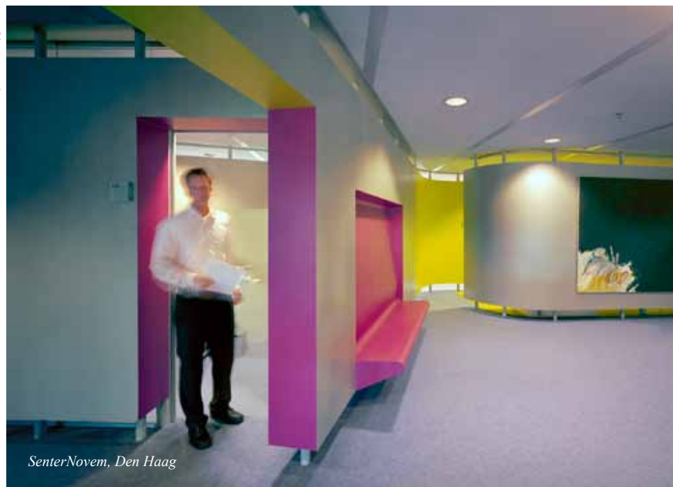
SenterNovem, Den Haag