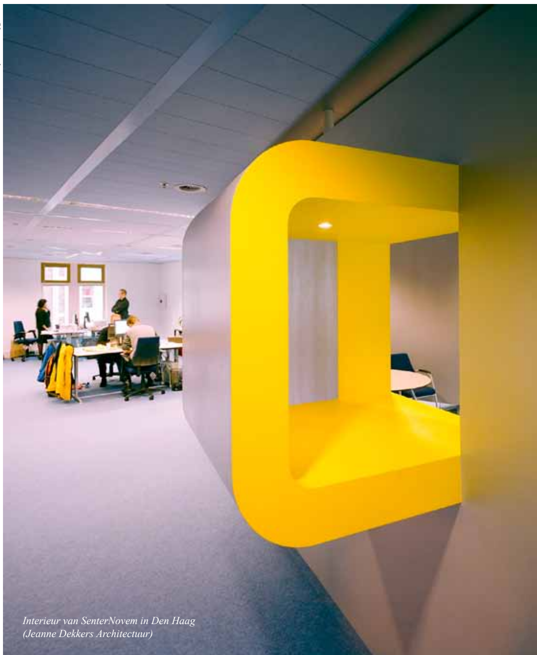
Interieur van SenterNovem in Den Haag (Jeanne Dekkers Architectuur)